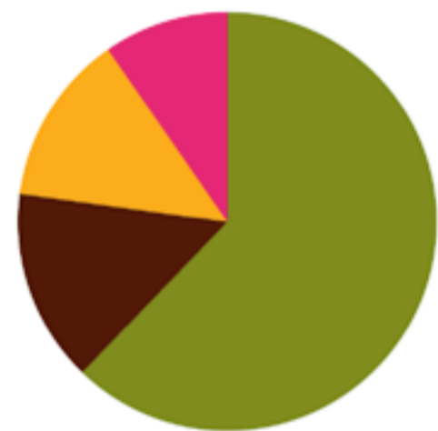
Stand van zaken aansluiting gemeenten