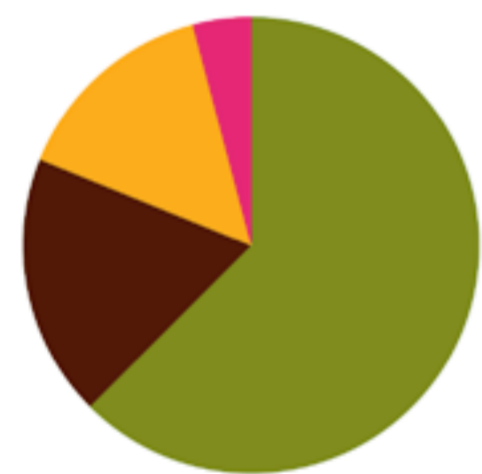
Stand van zaken aansluiting samenwerkingsverbanden