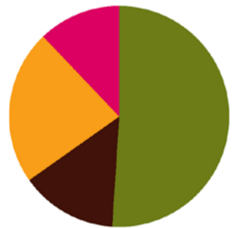
Stand van zaken aansluiting gemeenten

‘We zien dat het CBS de LV WOZ al gebruikt om de belastingcapaciteit te bepalen. Verder raadplegen waterschappen al vaker via MijnKadaster individuele objecten. Het aanpassen van applicaties bij de Belastingdienst vraagt nog wel aandacht. Zodra de laatste gemeente is aangesloten komt voor hen eveneens de deadline in zicht, en dat werkt natuurlijk ook weer stimulerend.’