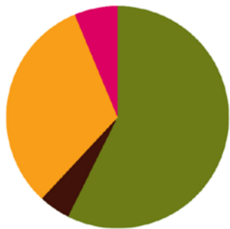
Stand van zaken aansluiting samenwerkingsverbanden